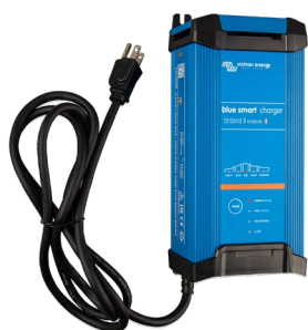
Blue Smart IP22 12/30 (3)