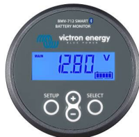
Contrôleur de batterie BMV-712 Smart