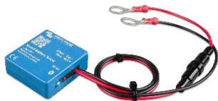
Smart Battery Sense Permet d'activer la charge à compensation de tension et de température.